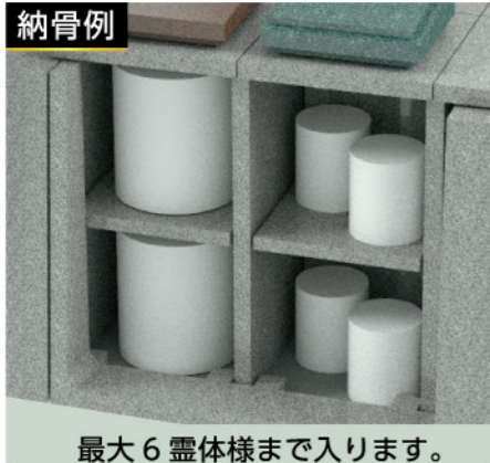
最大6 霊体様まで入ります。