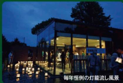
毎年恒例の灯笼流し風景