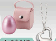
ジュエリータイプ