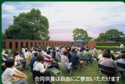
合同供養は自由にご参加いただけます