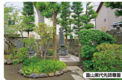
當山累代先師尊靈