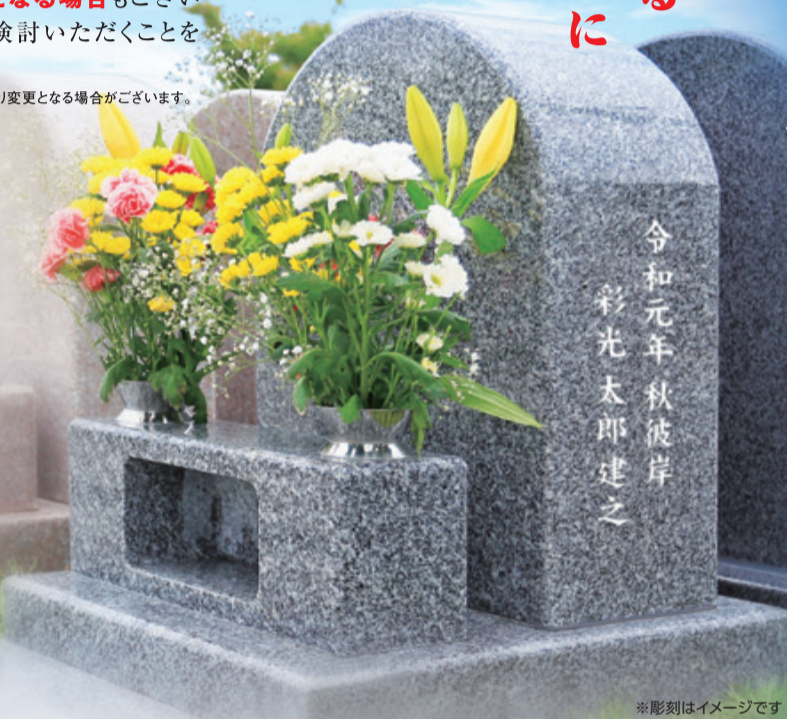
※彫刻はイメージです